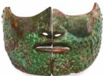
Maschere e oggetti di argento e di bronzo. La maschera è una cosa che metti sopra la faccia per farla sembrare diversa.