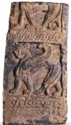
Statue e oggetti far capire dove erano le tombe.